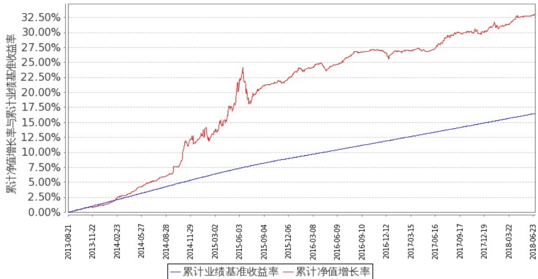
图1：嘉实丰益信用定期债券A基金份额累计净值增长率与同期业绩比较基准收益率的历史走势对比图（2013年8月21日至2018年6月30日）