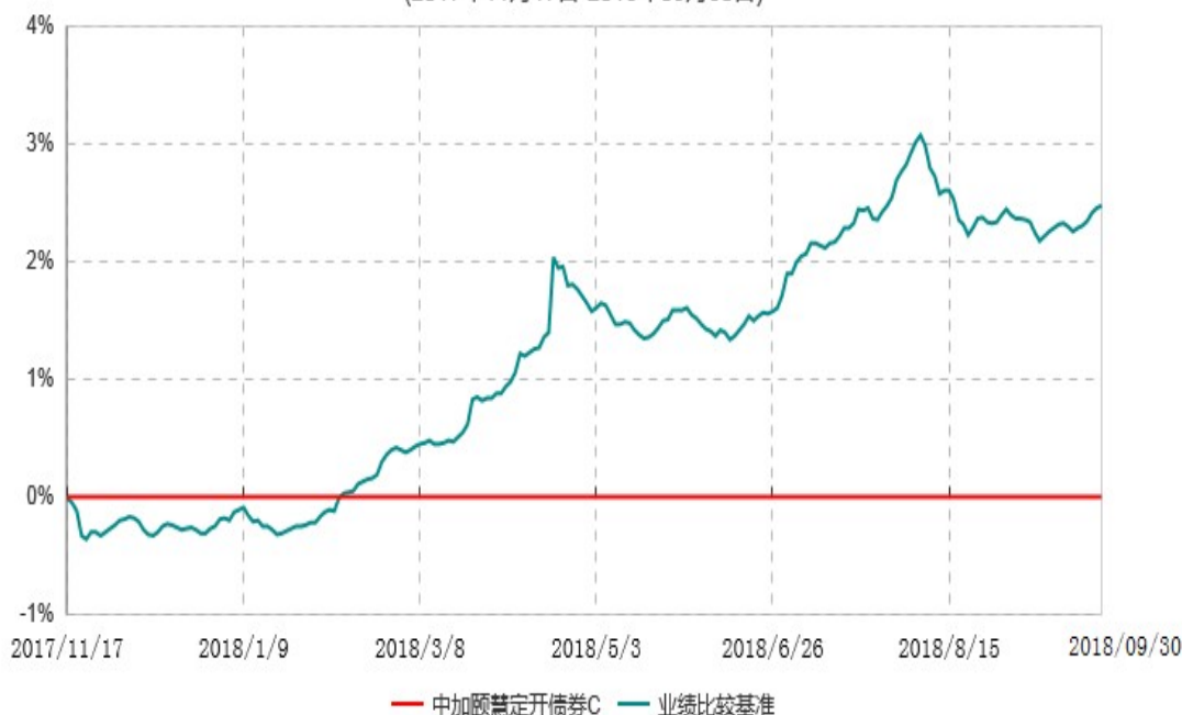
中加颐慧定开债券C累计净值增长率与业绩比较基准收益率历史走势对比图 (2017年11月17日-2018年09月30日)