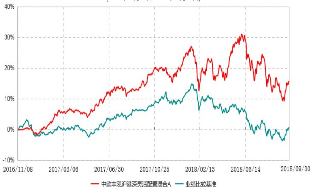
中欧丰泓沪港深灵活配置混合C累计净值增长率与业绩比较基准收益率历史走势对比图