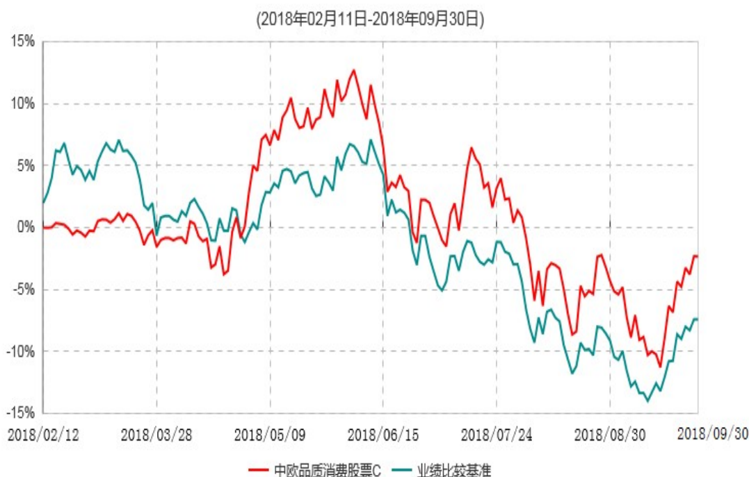
中欧品质消费股票C累计净值增长率与业绩比较基准收益率历史走势对比图

注：本基金基金合同生效日期为 2018 年 2 月 11 日，自基金合同生效日起到本报告期末不满一年，按基金合同的规定，本基金自基金合同生效起六个月为建仓期，建仓期结束时各项资产配置比例已符合基金合同约定。