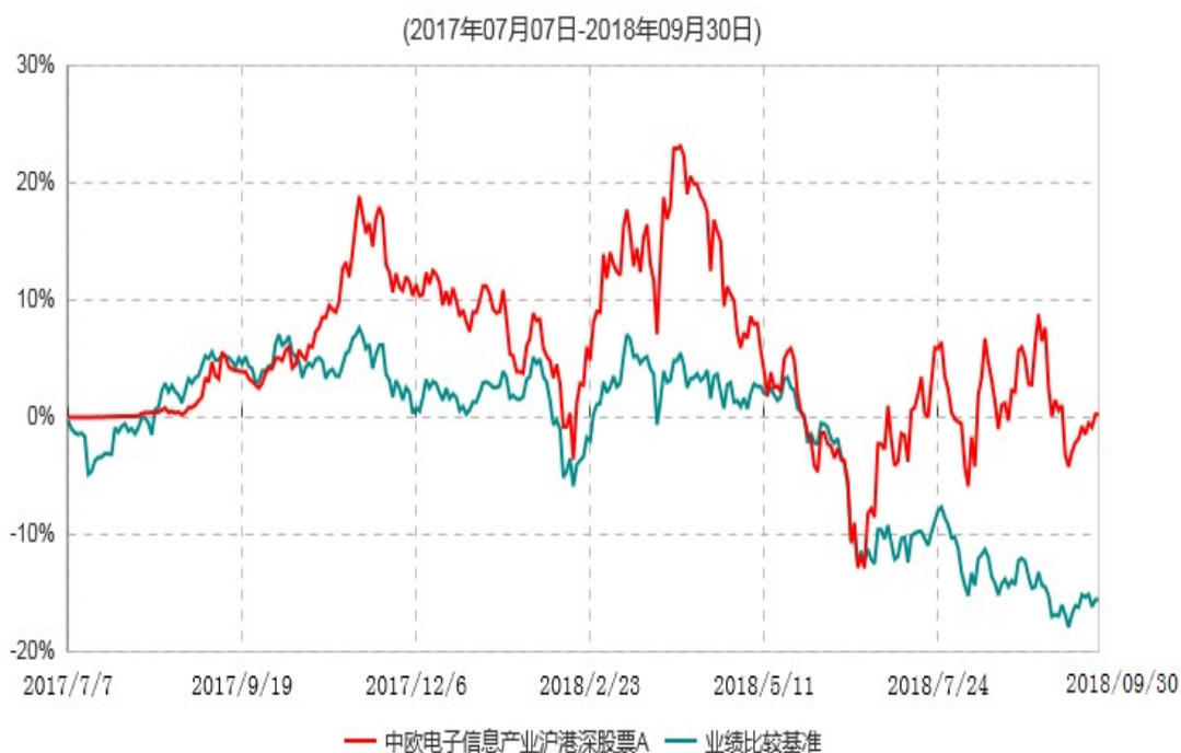
中欧电子信息产业沪港深股票A累计净值增长率与业绩比较基准收益率历史走势对比图

注：本基金基金合同生效日期为 2017 年 7 月 7 日，按基金合同的规定，本基金自基金合同生效起六个月为建仓期，建仓期结束时各项资产配置比例已达到基金合同约定。