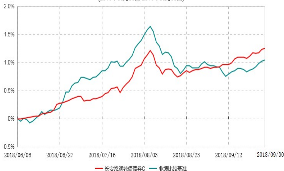
长安泓润纯债债券C累计净值增长率与业绩比较基准收益率历史走势对比图 (2018年06月06日-2018年09月30日)

根据基金合同的规定，自基金合同生效日起 6 个月内基金各项资产配置比例需符合基金合同要求。本基金仍在建仓期。基金合同生效日至报告期末，本基金运作时间未满一年。图示日期为 2018 年 06 月 06 日至 2018 年 9 月 30 日。