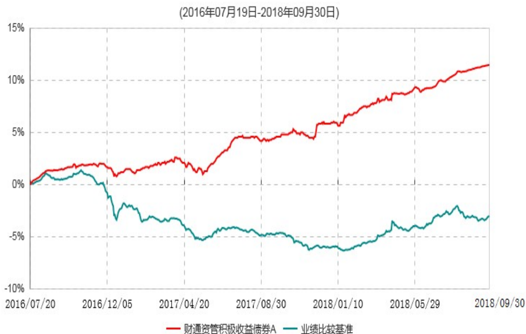
财通资管积极收益债券A累计净值增长率与业绩比较基准收益率历史走势对比图