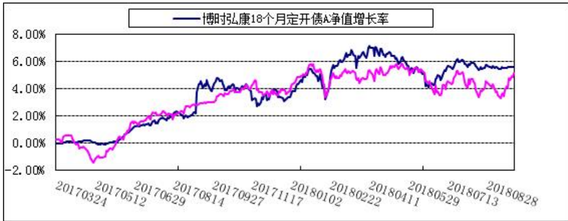
2. 博时弘康18个月定开债C: