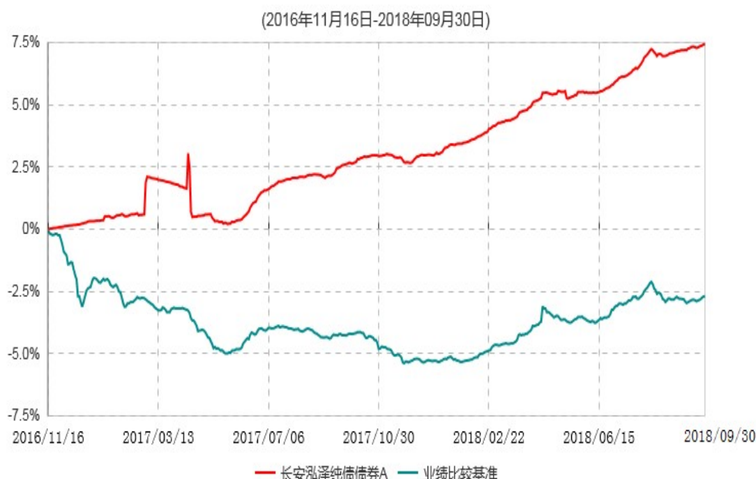
长安泓泽纯债债券A累计净值增长率与业绩比较基准收益率历史走势对比图