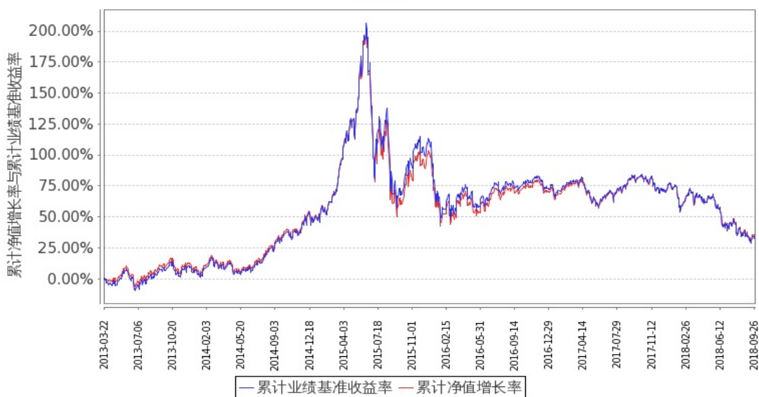
图 1：嘉实中证 500ETF 联接 A 份额累计净值增长率与同期业绩比较基准收益率的历史走势对比图