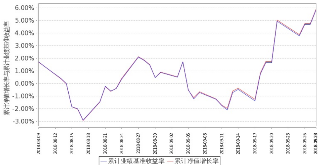
图 2: 嘉实基本面 50 指数 (LOF) C 基金份额累计净值增长率与同期业绩比较基准收益率的历史走势对比图