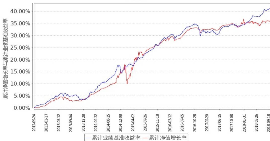
图 1：嘉实增强收益定期债券 A 基金份额累计净值增长率与同期业绩比较基准收益率的历史走势对比图