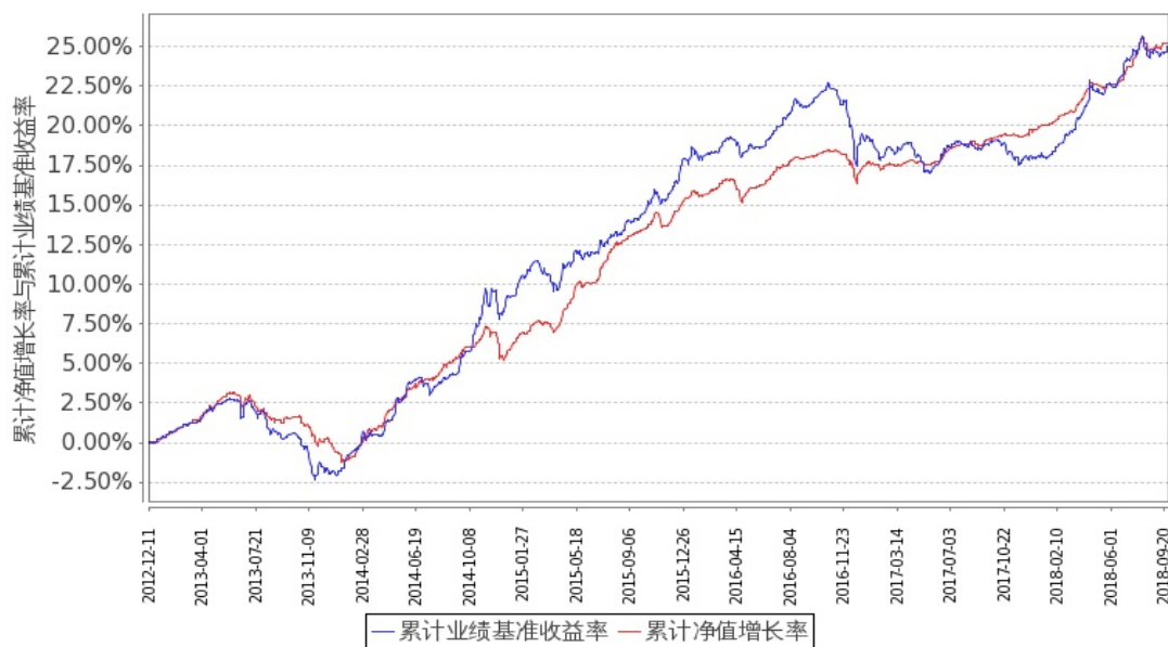
图 2：嘉实纯债债券 C 基金份额累计净值增长率与同期业绩比较基准收益率的历史走势对比图 (2012 年 12 月 11 日至 2018 年 9 月 30 日)

注：按基金合同和招募说明书的约定，本基金自基金合同生效日起 6 个月内为建仓期，建仓期结