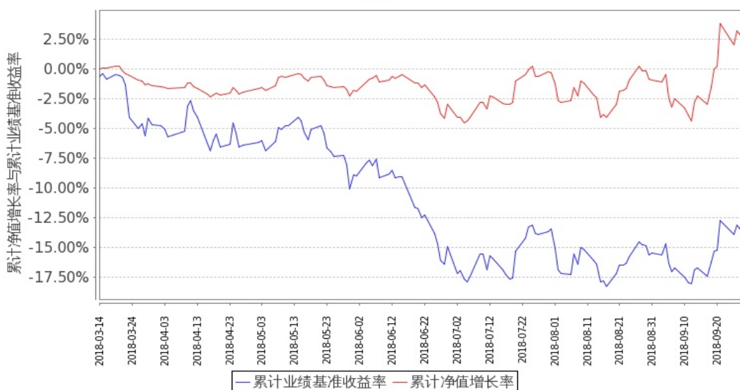
嘉实金融精选股票C累计净值增长率与同期业绩比较基准收益率的历史走势对比图