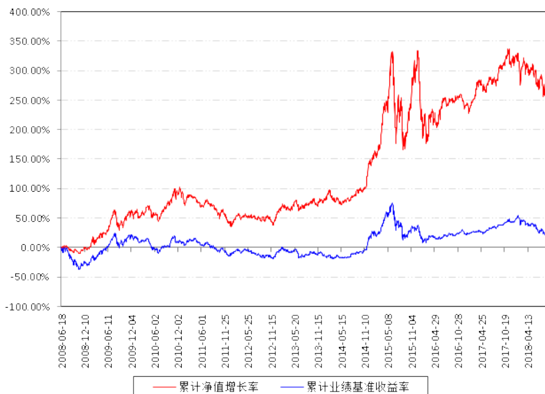
南方优选价值混合A累计净值增长率与同期业绩比较基准收益率的历史走势对比图