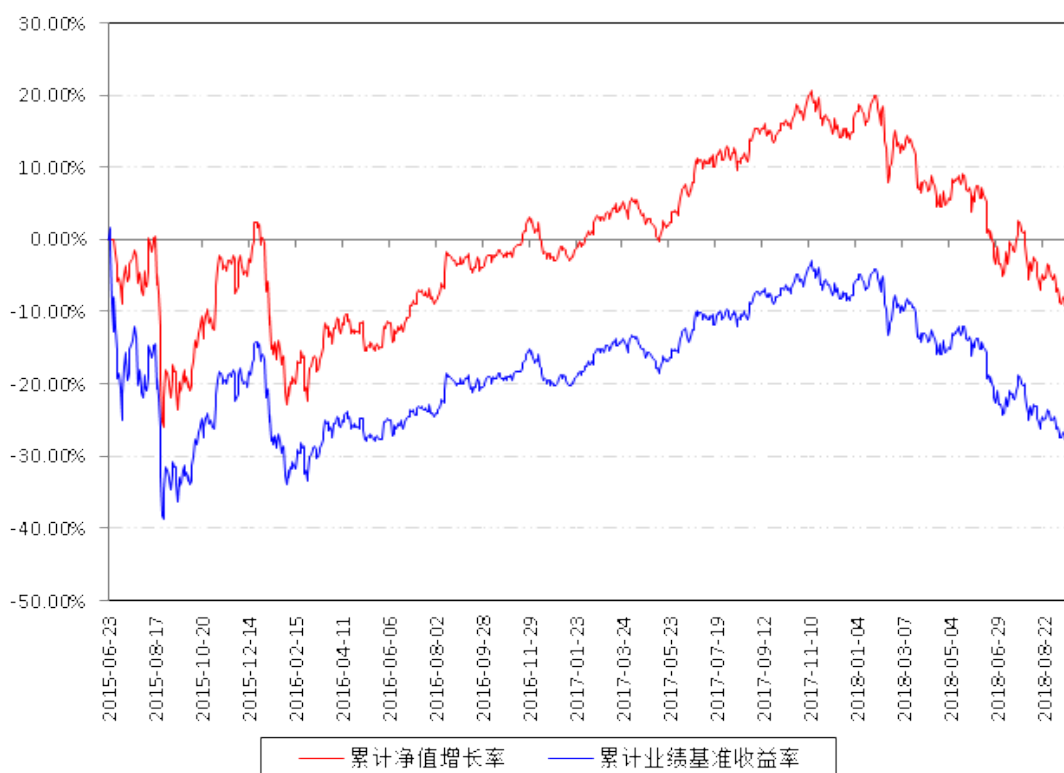
大数据300A级累计净值增长率与同期业绩比较基准收益率的历史走势对比图