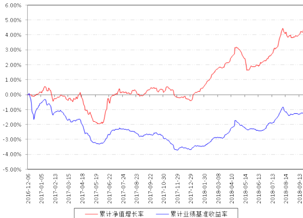
南方宣利A累计净值增长率与同期业绩比较基准收益率的历史走势对比图