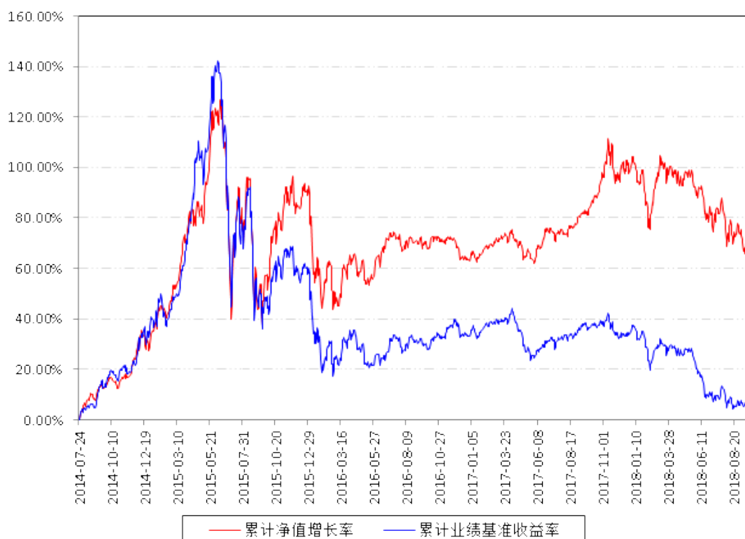
南方高端装备灵活配置混合A累计净值增长率与同期业绩比较基准收益率的历史走势对比图