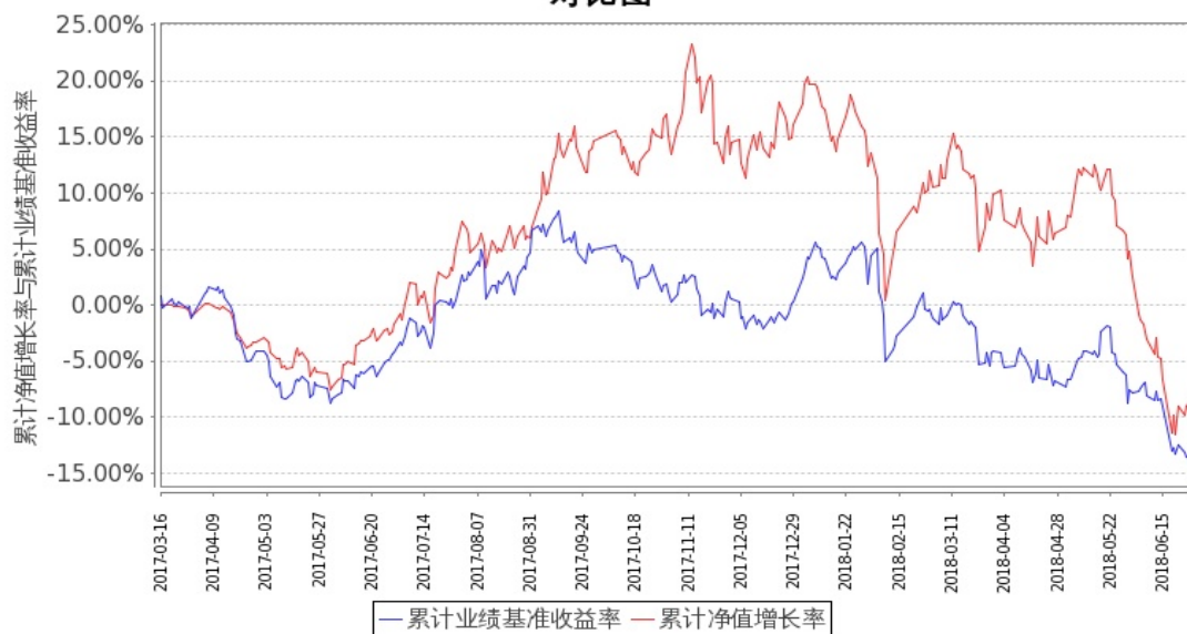
图 1：嘉实新能源新材料股票 A 基金累计份额净值增长率与同期业绩比较基准收益率的历史走势对比图