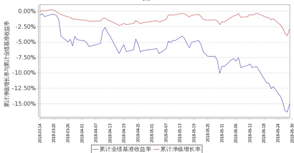
图 1: 嘉实金融精选股票 A 基金份额累计净值增长率与同期业绩比较基准收益率的历史走势对比图 (2018 年 3 月 14 日至 2018 年 6 月 30 日)