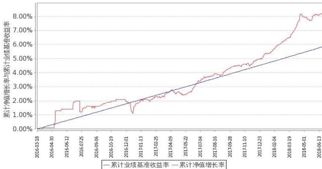
图 1：嘉实稳祥纯债债券 A 基金份额累计净值增长率与同期业绩比较基准收益率的历史走势对比图