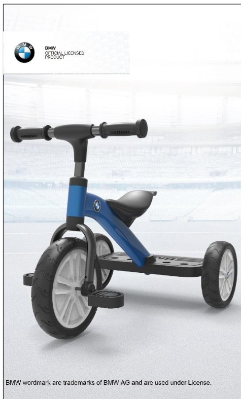
玩具IP储备厚积薄发 新品布局多样化