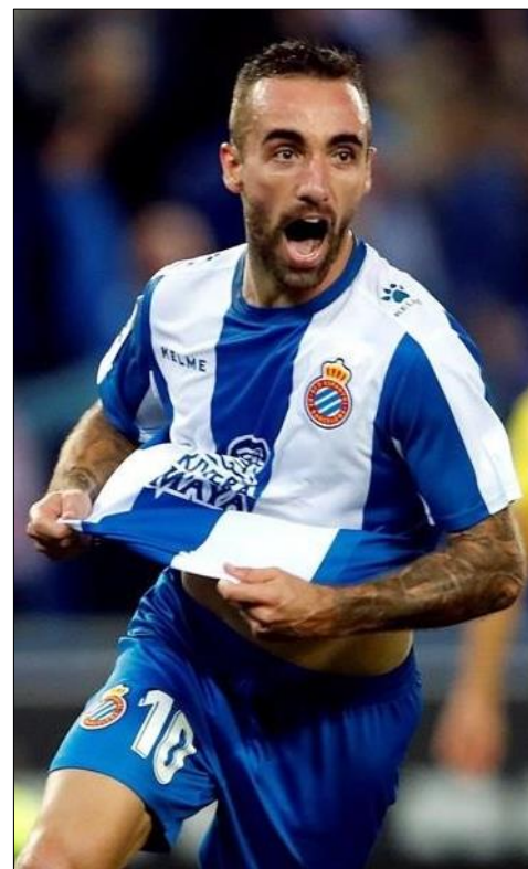
西班牙人新赛季实力尽显 冲击欧联欧冠席位