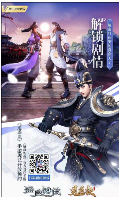
腾讯独代 《盛唐幻夜》官方手游《逍遥诀》