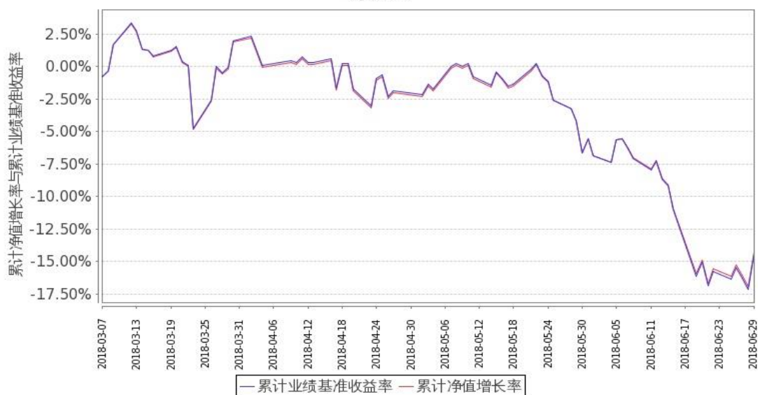
图 2: 嘉实中创 400ETF 联接 C 基金份额累计净值增长率与同期业绩比较基准收益率的历史走势对比图