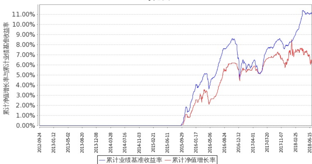
图2：嘉实增强收益定期债券C基金份额累计净值增长率与同期业绩比较基准收益率的