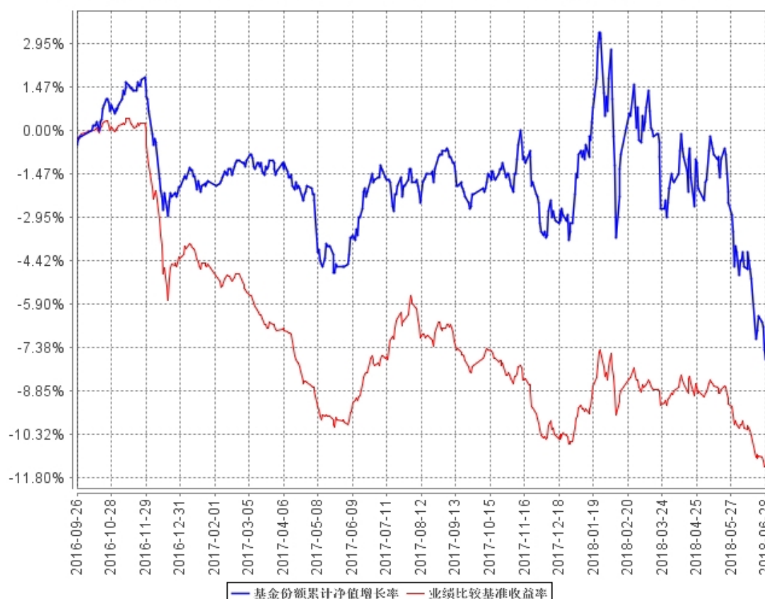
基金份额累计净值增长率与同期业绩比较基准收益率的历史走势对比图