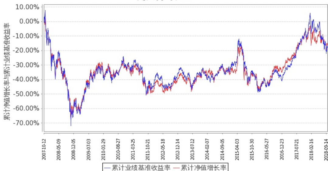
嘉实海外中国股票混合(QDII)累计净值增长率与同期业绩比较基准收益率的历史走势对比图