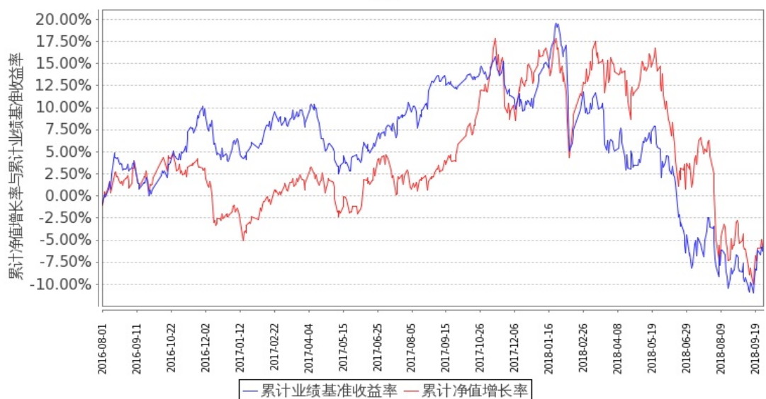
图 2：嘉实成长收益混合 H 基金份额累计净值增长率与同期业绩比较基准收益率的历史走势对比图