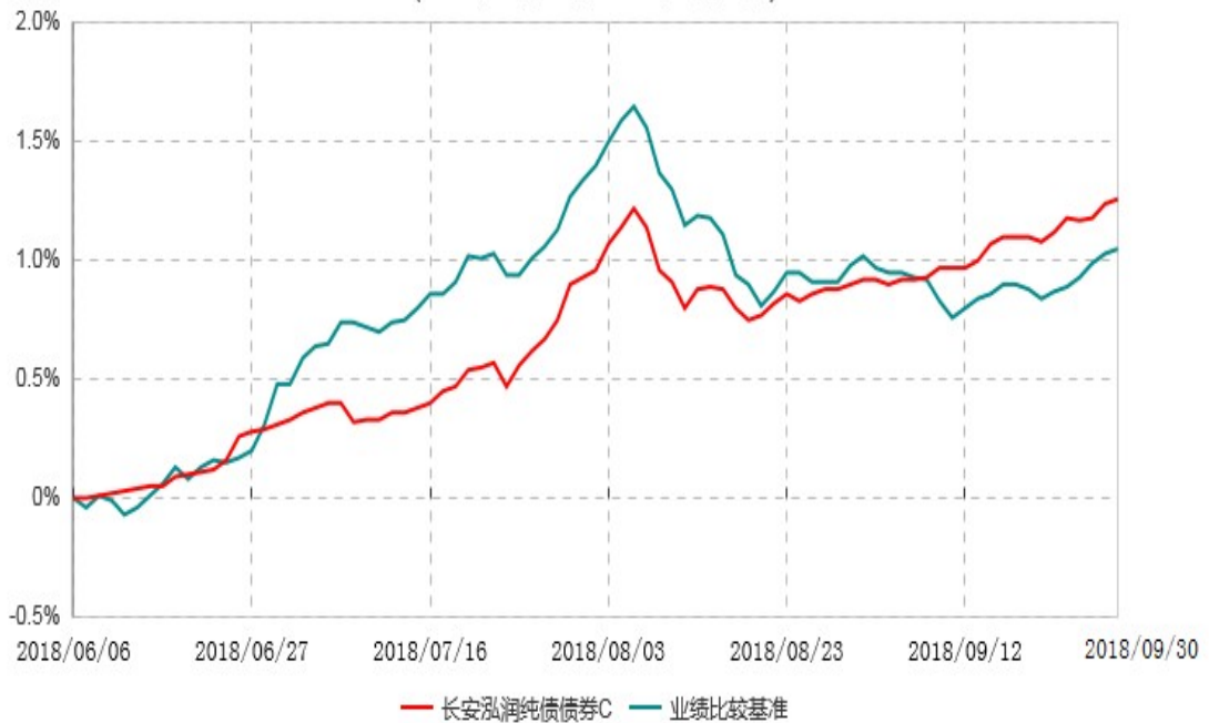
长安泓润纯债债券C累计净值增长率与业绩比较基准收益率历史走势对比图 (2018年06月06日-2018年09月30日)

根据基金合同的规定，自基金合同生效日起6个月内基金各项资产配置比例需符合基金合同要求。本基金仍在建仓期。基金合同生效日至报告期末，本基金运作时间未满一年。