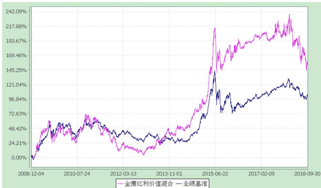
金鹰红利价值灵活配置混合型证券投资基金 累计净值增长率与业绩比较基准收益率历史走势对比图 (2008 年 12 月 4 日至 2018 年 9 月 30 日)