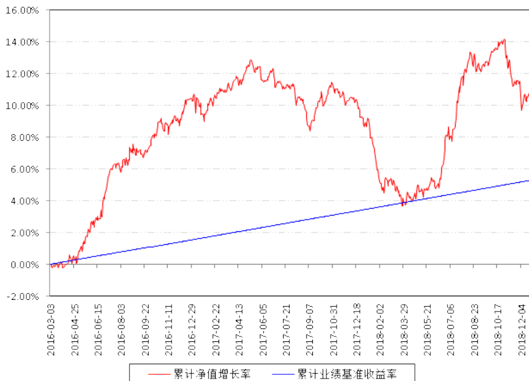
南方亚洲美元债A累计净值增长率与同期业绩比较基准收益率的历史走势对比图