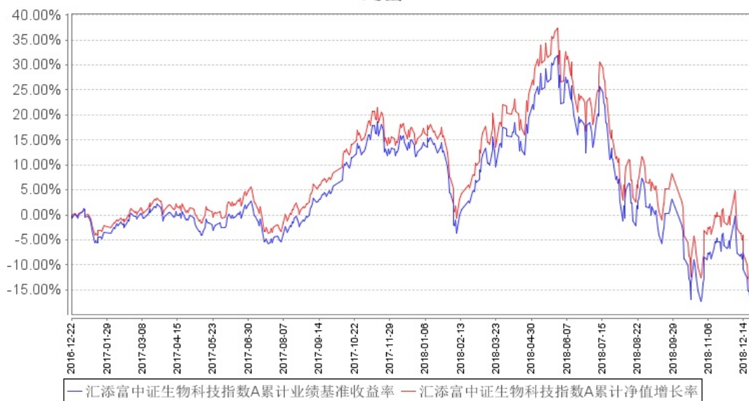
汇添富中证生物科技指数A累计净值增长率与同期业绩比较基准收益率的历史走势对比图