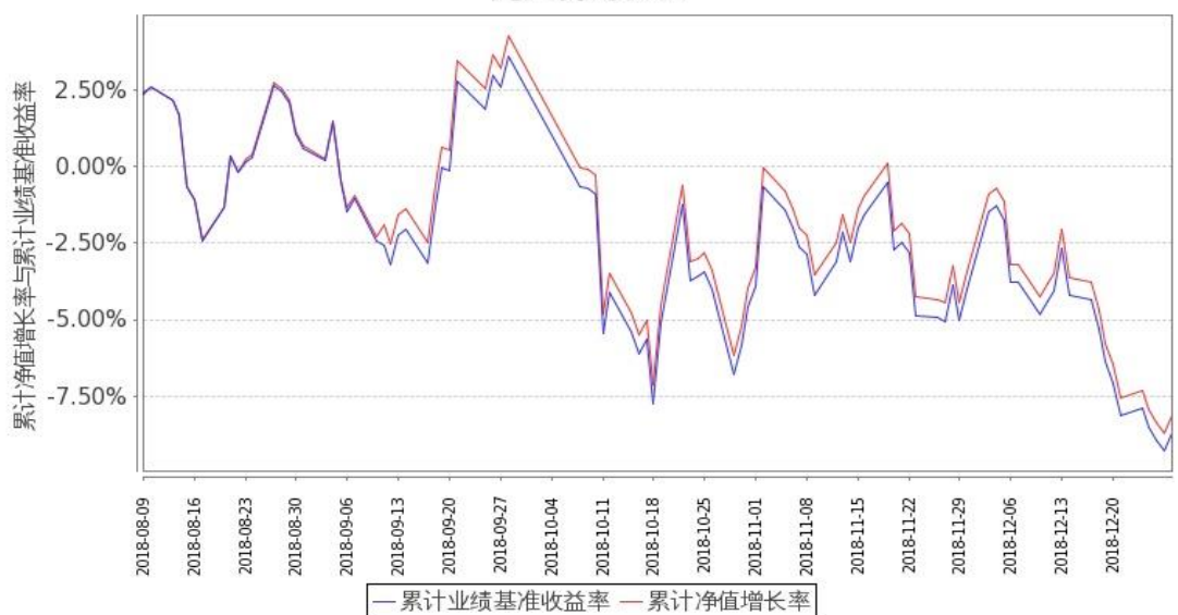
图 2：嘉实沪深 300ETF 联接(LOF)C 基金份额累计净值增长率与同期业绩比较基准收益率的历史走势对比图 (2018 年 8 月 9 日至 2018 年 12 月 31 日)

注：根据 2012 年 8 月 21 日中国证监会《关于核准嘉实沪深 300 指数证券投资基金（LOF）基金份额持有人大会决议的批复》（证监许可[2012]1146 号），变更了投资范围并更名为嘉实沪深 300 交易型开放式指数证券投资基金联接基金（LOF）。本基金自 2012 年 8 月 21 日起 3 个月内为建仓期（原持有的沪深 300 指数成份股、备选成份股调整为嘉实沪深 300ETF），建仓期结束时本基金的各项投资比例符合基金合同第十七条（二）投资范围和（七）投资禁止行为与限制）的规定：（1）