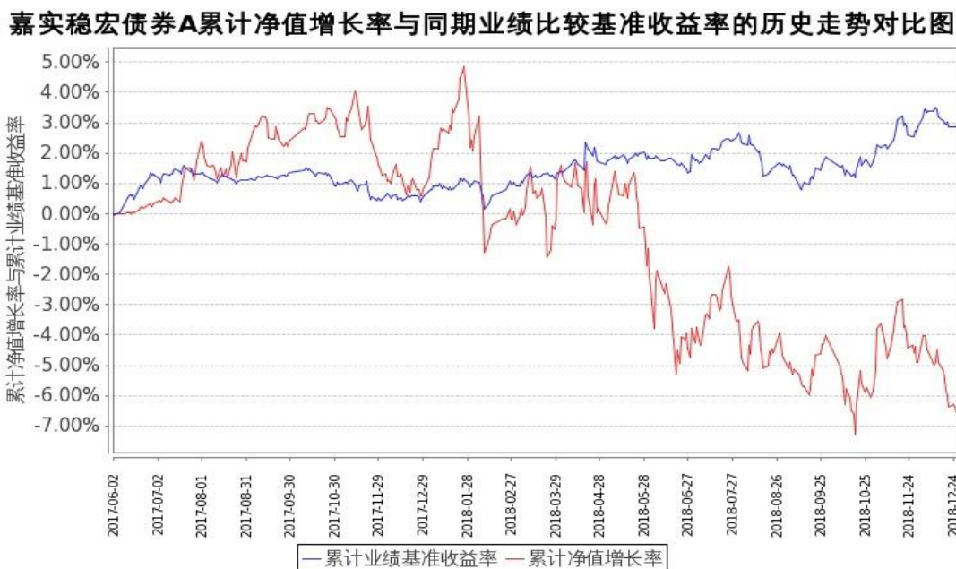
图 1：嘉实稳宏债券 A 基金份额累计净值增长率与同期业绩比较基准收益率的历史走势对比图