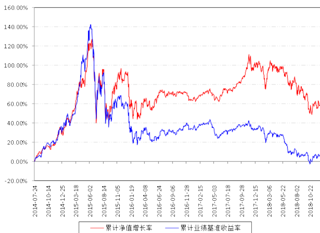
南方高端装备灵活配置混合A累计净值增长率与同期业绩比较基准收益率的历史走势对比图