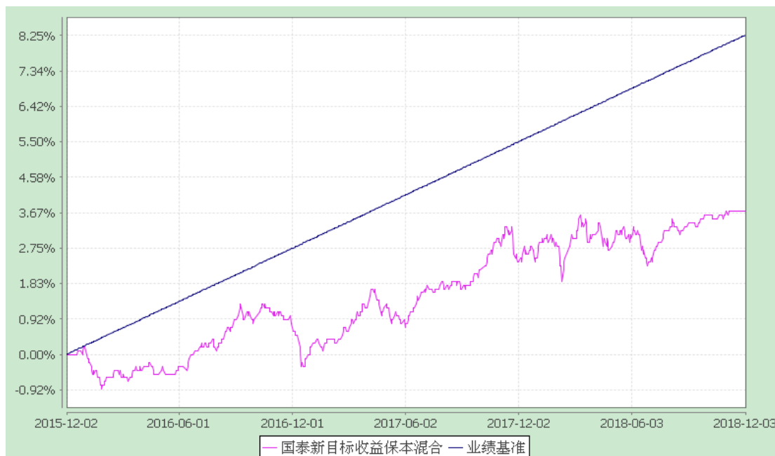
国泰新目标收益保本混合型证券投资基金 份额累计净值增长率与业绩比较基准收益率历史走势对比图 (2015年12月2日-2018年12月3日)

注：本基金的合同生效日为2015年12月2日。本基金在六个月建仓期结束时，各项资产配置比例符合合同约定。