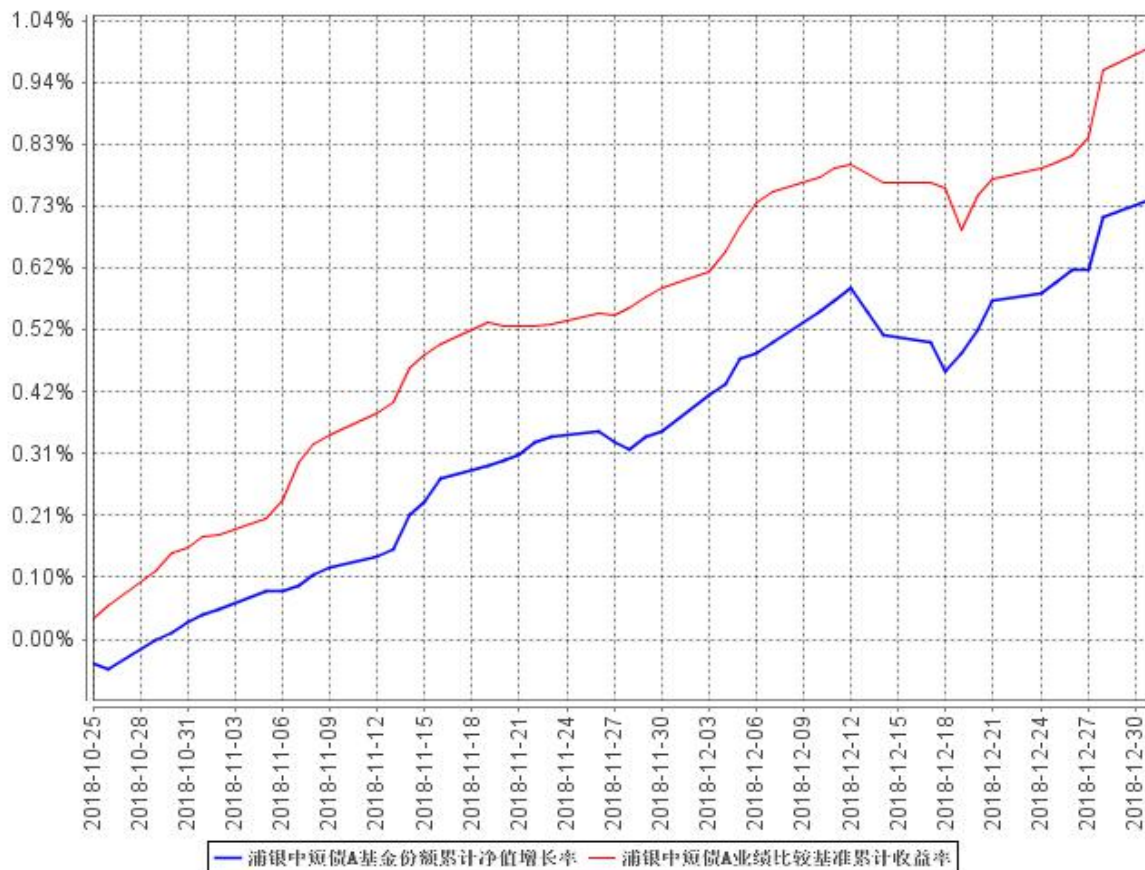
浦银中短债A基金份额累计净值增长率与同期业绩比较基准收益率的历史走势对比图