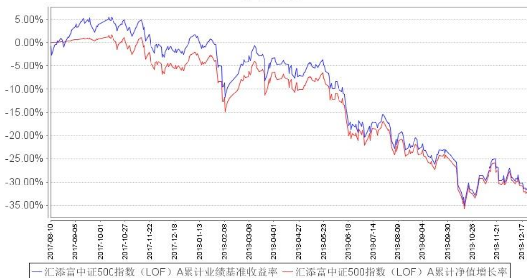
汇添富中证500指数 (LOF) A 累计净值增长率与同期业绩比较基准收益率的历史走势对比图