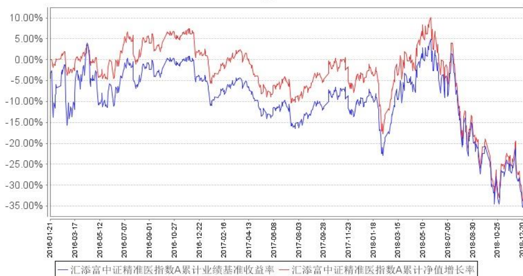
汇添富中证精准医指数A累计净值增长率与同期业绩比较基准收益率的历史走势对比图