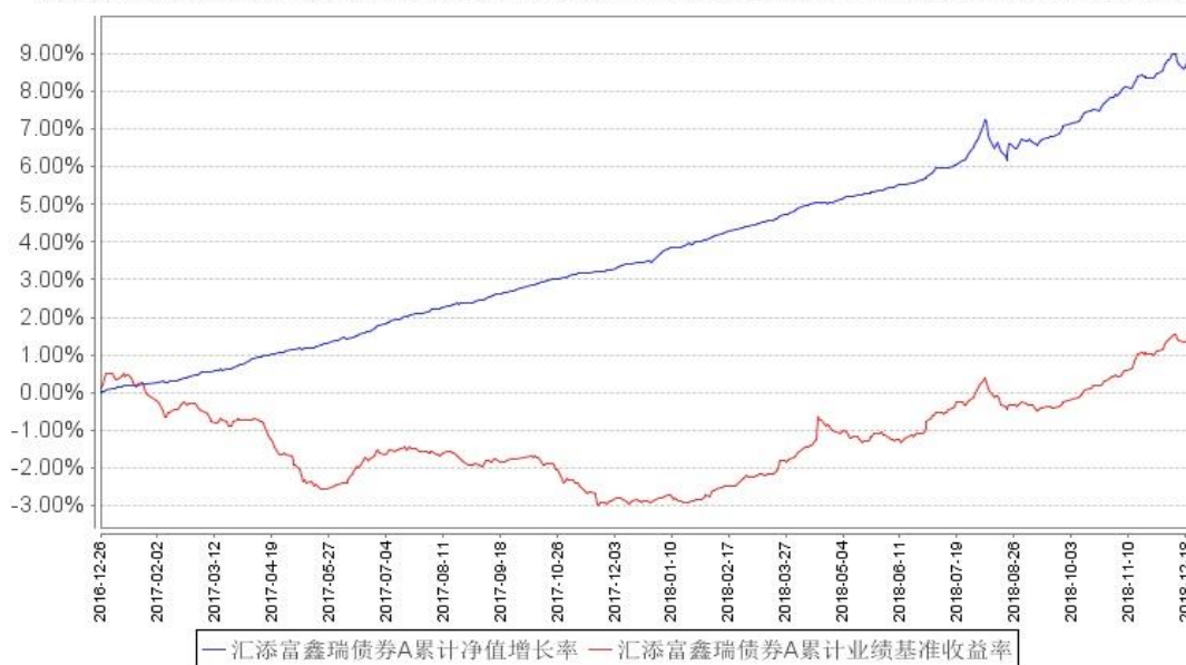
汇添富鑫瑞债券A累计净值增长率与同期业绩比较基准收益率的历史走势对比图