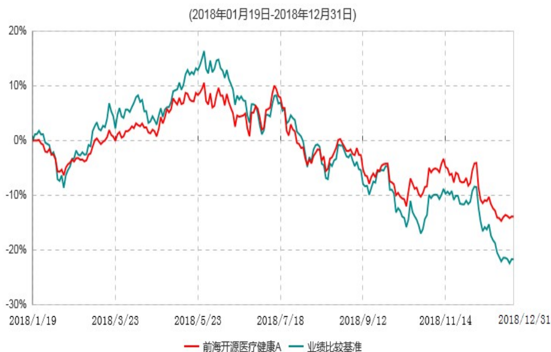
前海开源医疗健康A累计净值增长率与业绩比较基准收益率历史走势对比图