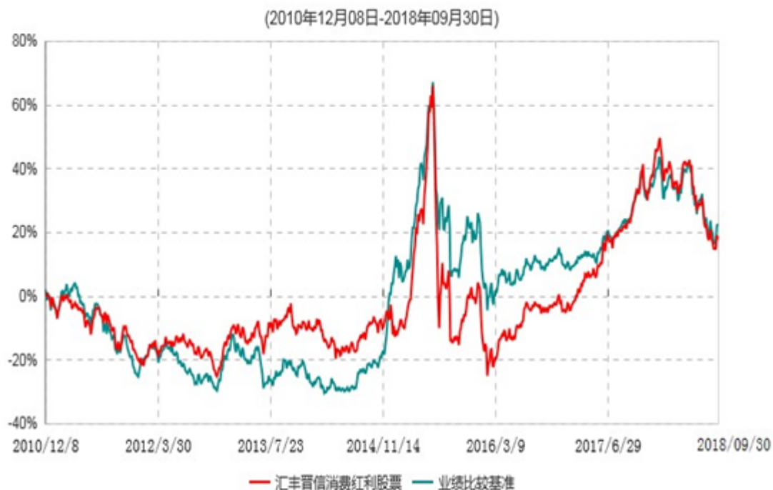
汇丰晋信消费红利股票型证券投资基金累计净值增长率与业绩比较基准收益率历史走势对比图

注：1. 按照基金合同的约定，本基金的投资组合比例为：股票投资比例范围为基金资产的 85%–95%，权证投资比例范围为基金资产净值的 0%–3%。固定收益类证券、现金和其他资产投资比例范围为基金资产的 5%–15%，其中现金（不包括结算备付金、存出保证金、应收申购款等）或到期日在一年以内的政府债券的投资比例不低于基金资产净值的 5%。按照基金合同的约定，本基金自基金合同生效日起不超过 6 个月内完成建仓，截止 2011 年 6 月 8 日，本基金的各项投资比例已达到基金合同约定的比例。