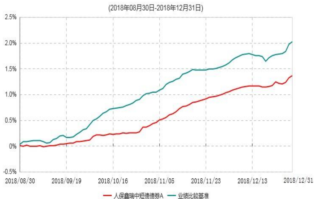
人保鑫瑞中短债债券A累计净值增长率与业绩比较基准收益率历史走势对比图