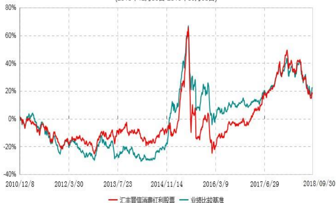
汇丰晋信消费红利股票型证券投资基金累计净值增长率与业绩比较基准收益率历史走势对比图 (2010年12月08日-2018年09月30日)

注：1. 按照基金合同的约定，本基金的投资组合比例为：股票投资比例范围为基金资产的 85%-95%，权证投资比例范围为基金资产净值的 0%-3%。固定收益类证券、现金和其他资产投资比例范围为基金资产的 5%-15%，其中现金（不包括结算备付金、存出保证金、应收申购款等）或到期日在一年以内的政府债券的投资比例不低于基金资产净值的 5%。按照基金合同的约定，本基金自基金合同生效日起不超过 6 个月内完成建仓，截止 2011 年 6 月 8 日，本基金的各项投资比例已达到基金合同约定的比例。