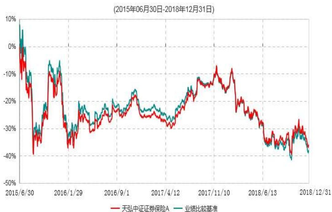
天弘中证证券保险A累计净值增长率与业绩比较基准收益率历史走势对比图