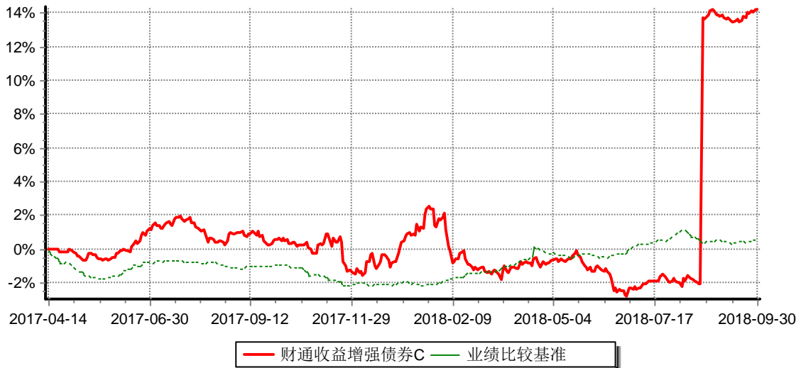
财通收益增强债券型证券投资基金C 累计净值增长率与业绩比较基准收益率历史走势对比图 (2017年4月14日-2018年9月30日)

注: (1)本基金合同生效日为2012年12月20日,根据合同规定,第一个保本周期到期日为2015年12月21日,本基金于2015年12月25日转型为非保本的债券型证券投资基金;