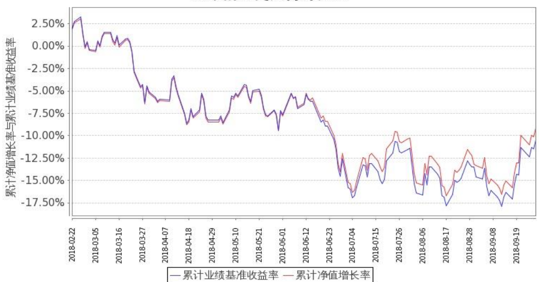
图 2：嘉实富时中国 A50ETF 联接基金 C 类基金份额累计净值增长率与同期业绩比较基准收益率的历史走势对比图 (2018 年 2 月 22 日至 2018 年 9 月 30 日)

注：按基金合同和招募说明书的约定，本基金自基金合同生效日起 6 个月内为建仓期，建仓期结束时本基金的各项投资比例符合基金合同（十二（二）投资范围和（四）投资限制）的