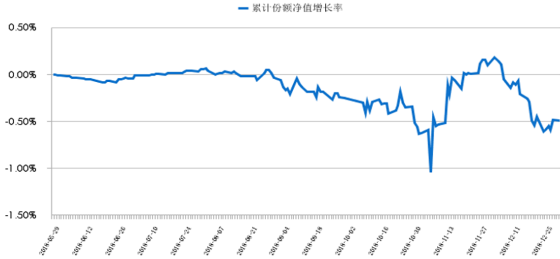
中金福睿1号集合资产管理计划累计份额净值增长率历史走势图 (2018年5月29日至2018年12月31日)