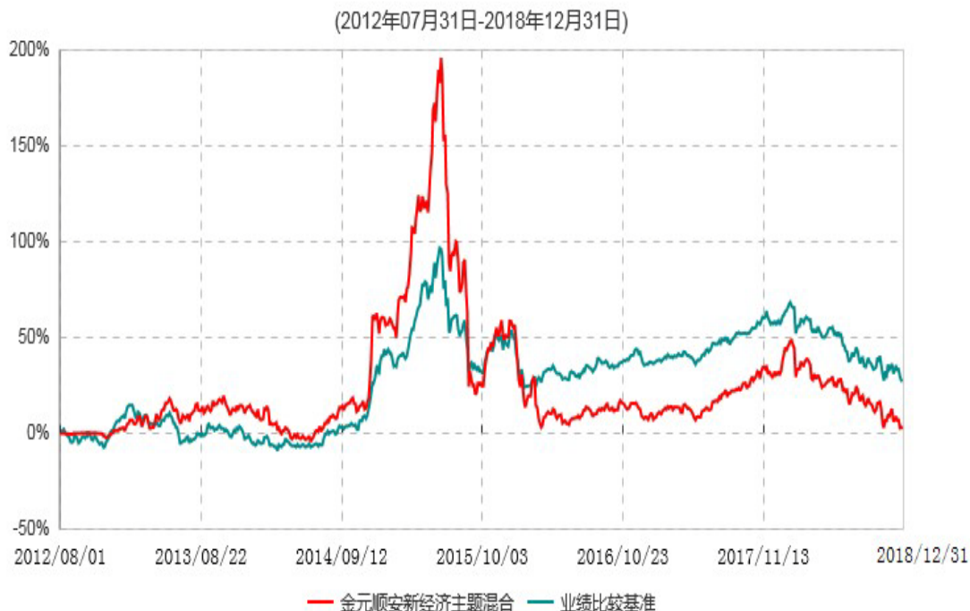
金元顺安新经济主题混合型证券投资基金累计净值增长率与业绩比较基准收益率历史走势对比图