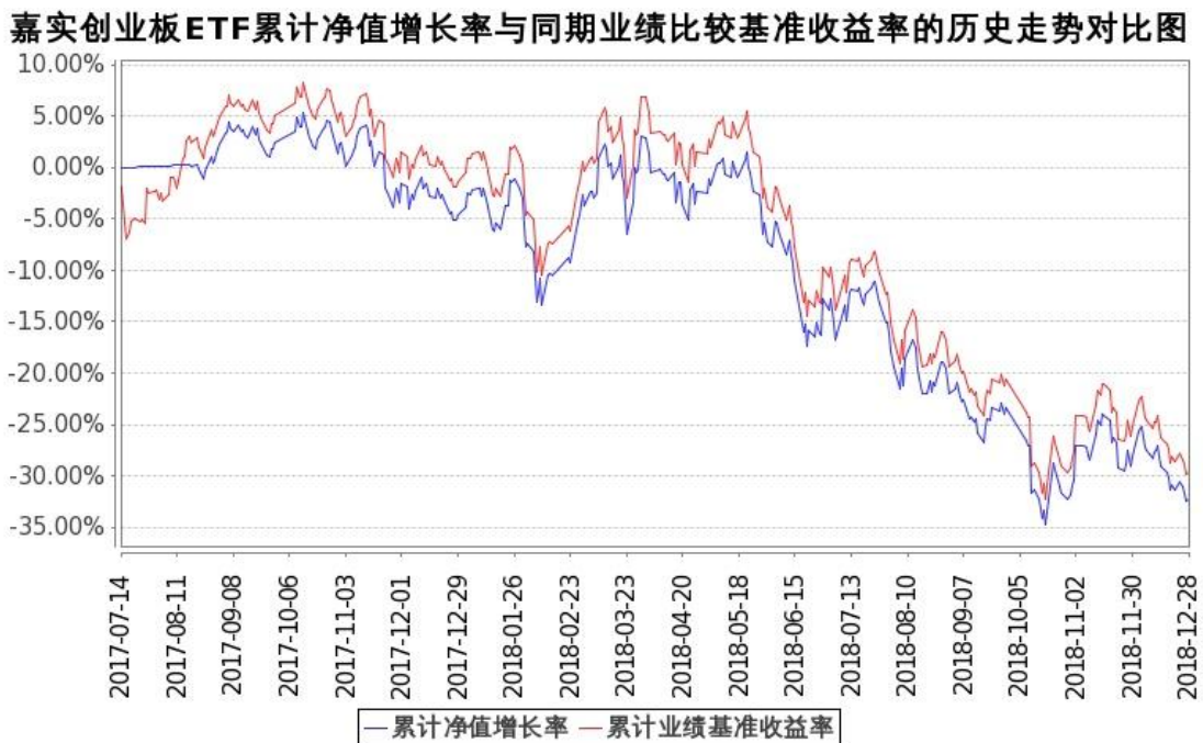
图：嘉实创业板 ETF 基金份额累计净值增长率与同期业绩比较基准收益率的历史走势对比图