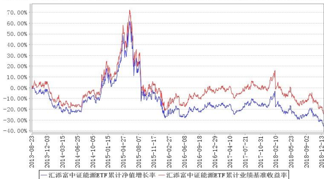
汇添富中证能源ETF累计净值增长率与同期业绩比较基准收益率的历史走势对比图

注:本基金建仓期为本《基金合同》生效之日(2013年8月23日)起3个月,建仓结束时各项资产配置比例符合合同约定。